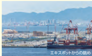
エキスポットからの眺め