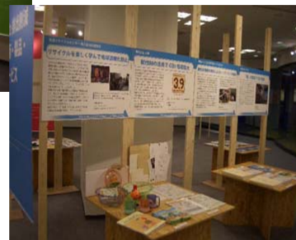
■CO2排出削減技術・製品・サービス 地球温暖化抑制に向けた企業の 取り組みを紹介