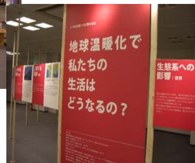
■地球温暖化で私たちの生活はどうなるの？