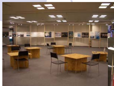
■「不都合な真実 特別パネル展」

おおさかATCグリーンエコプラザの出展企業における、地球温暖化抑制への 取り組みを紹介しています。