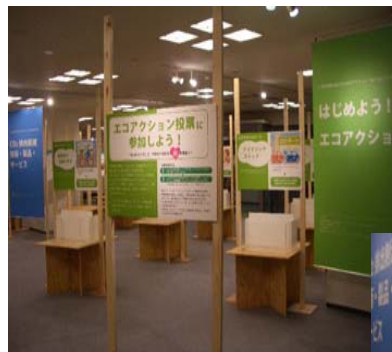
■はじめよう！エコアクション