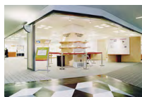
以减少垃圾量为主题，介绍经验的展区。