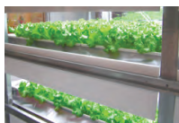
以食品的安全、放心及食品环境为主题的展区。设置有植物工场。