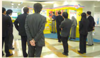
在企业的环境研修活动中来此参观。