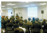
群落生境广场 (Biotope Plaza) 最多可容纳150人的会议厅