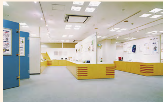
在财团法人日本环境协会的协力下，广泛展示生态标志认定产品。