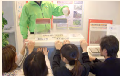
使用透水性砖做实验。

大气、水、噪音、废弃物、能源、全球气候变暖问题等等，与环境相关的问题一年比一年复杂，解决环境问题已成为当务之急。大阪ATC绿色生态广场以解决此类问题为目标，展示最新环境技术，以供参观。同时，随时举办对环境建设有益的研讨会和活动。