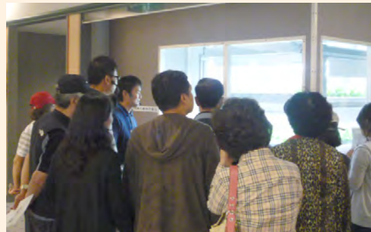
许多海外人士前来参观，以此作为视察及观光活动的一部分。