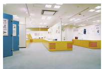
在财团法人日本环境协会的协助下，展示生态标志认定商品。