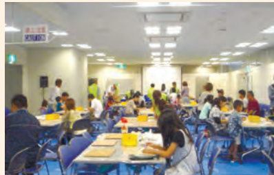
星期日手工制作教室在每月的第2、第4个星期日举行。