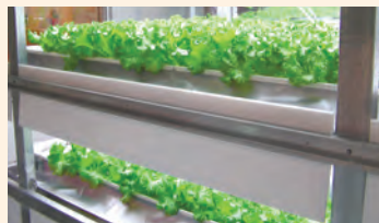
馆内设置的植物工场