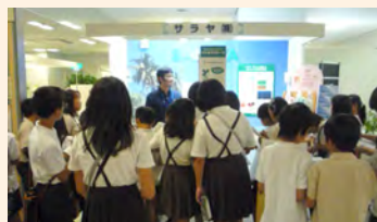
可面向小学生、初中生、高中生乃至大学生进行环境教育。