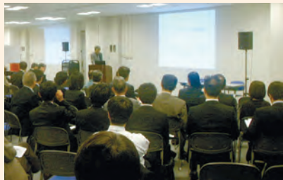
随时邀请环境商务的专家举行研讨会。

大阪ATC绿色生态广场介绍最新环境信息，为企业制定解决环境问题的措施提供借鉴。着眼于今后将日益多样化、有望不断发展扩大的环境商务，通过介绍企业的先进措施及举办研讨会等方式，支援企业开展新的环境商务。