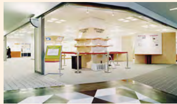
在3R启发展区，以减少垃圾量为主题介绍相关经验。