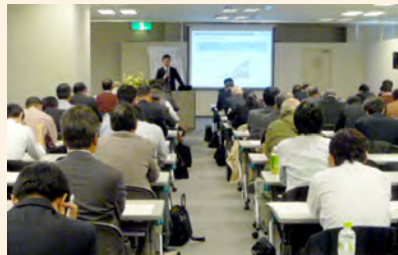
能够掌握环境商务的最新信息与动向。